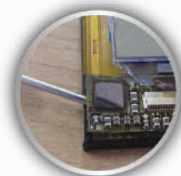
柔性线路板的粘接固定