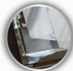
光学模组内薄膜材料固定