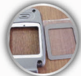
手机显示屏护屏粘接 (55258)