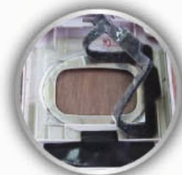
手机密封垫圈的粘接 (55256, 55257)